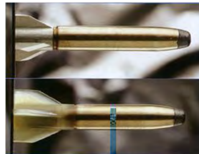
Рис. 2. Куля «Зеніт»

2) куля «Зеніт» – за Актом державних випробувань смертельне ураження цілій з першого пострілу з гладкоствольної мисливської рушниці на відстані 280 – 300 метрів, стрілець з 9,3 мм карабіном обладнаним оптичним прицілом відмовився від пострілу у зв'язку з великою відстанню та малою вірогідністю смертельного ураження цілі на місці. Конструкція кулі має великий запас удосконалення [7], (рис. 2).