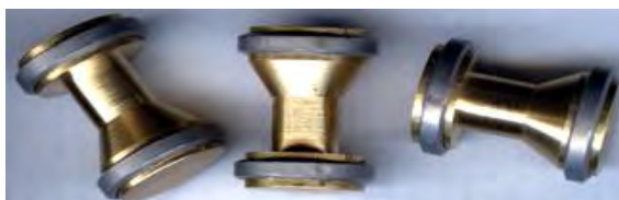
Рис. 1. Куля Блондо

1) куля Блондо на щорічних змаганнях у Франції на відстані 90 м зафіксований результат 5 влучень в коло 8 см, на відстані до 100 метрів енергія кулі близька до енергії кулі патрону 7,62X39 зразку 1943 року [5], (рис. 1);