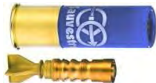
Рис. 3. Куля Sauvestre

3) куля Sauvestre [8] – спеціально розроблялась для БГЗ, силами спеціальних операцій Франції, окремі зразки кулі мають енергію на відстані до 100 метрів більшу чим у кулі патрону 7,62X39 зразку 1943 року для нарізної зброї (рис. 3).