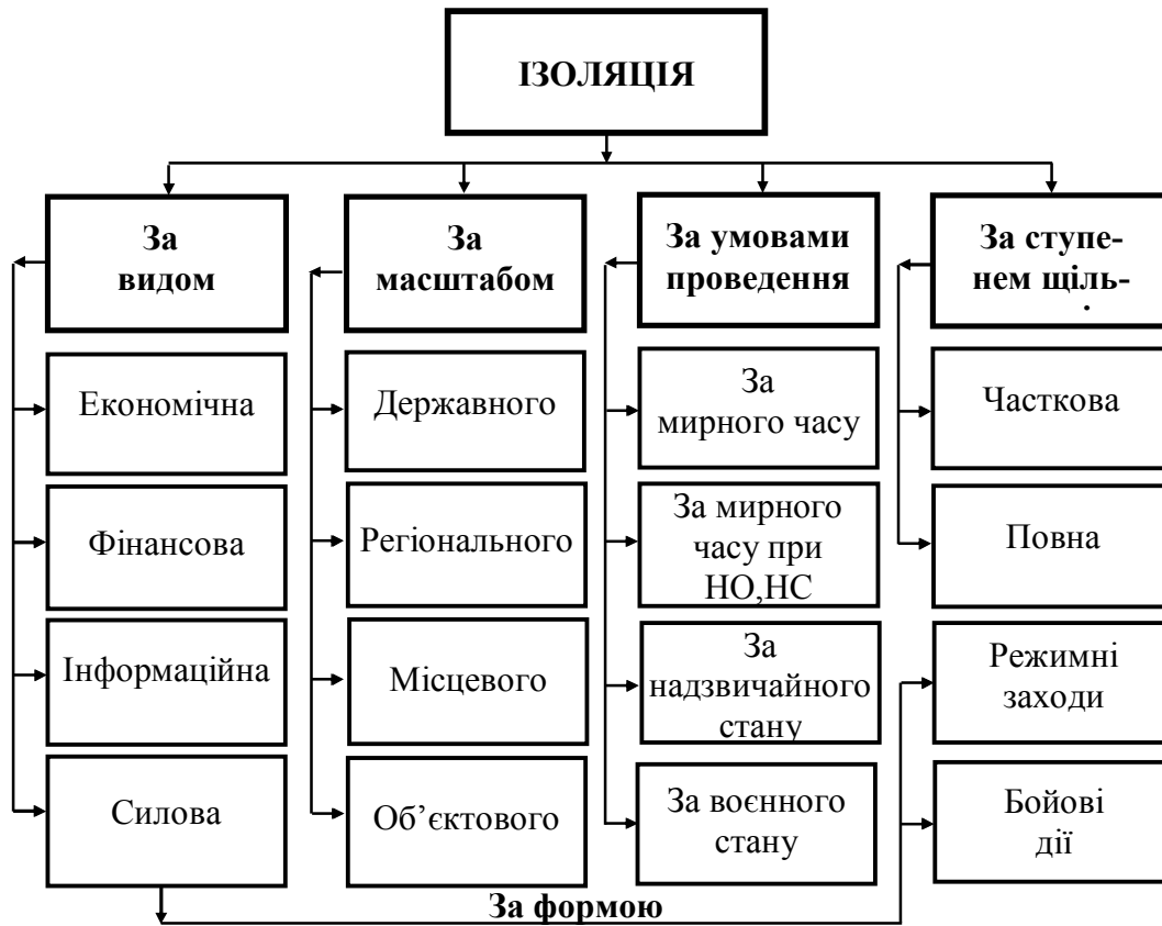
Рис. 1. Класифікація ізоляції