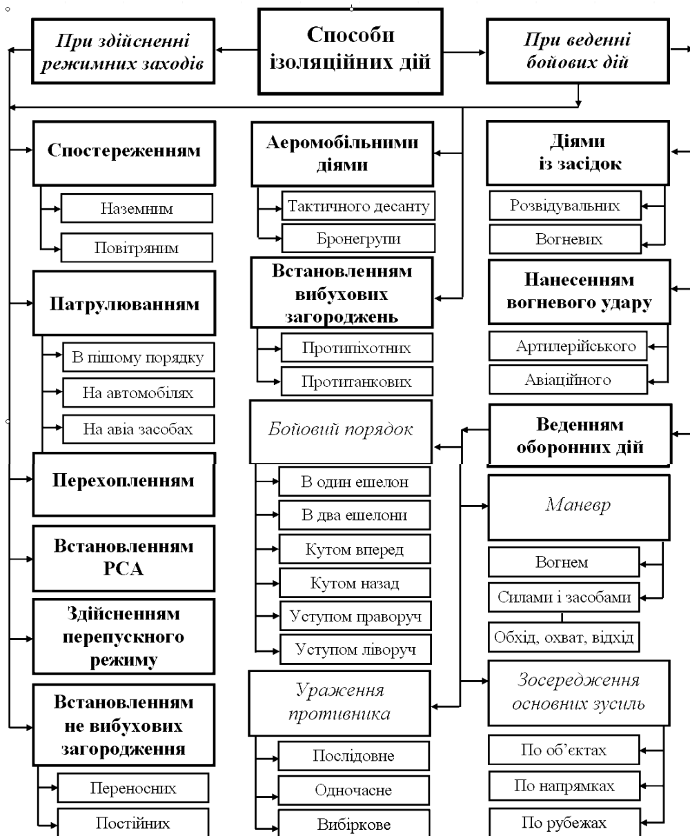
Рис. 3. Класифікація способів ізоляційних дій

якого завдання. Воєнною наукою способ дій тлумачиться як порядок та прийоми застосування сил і засобів для вирішення завдань в операції (бою), а його змістом є послідовність знищення (ураження) противника, напрямки зосередження основних зусиль, бойовий порядок і характер маневру. Однак на сьогоднішній день, терміни оцелення, блокування, оточення тлумачиться в статутах ВВ, в навчальній та науковій літературі, як способи військових дій, хоча і зовсім не підпадають під його визначення. Тому на думку авторів, при проведенні ізоляції району СО доцільно застосовувати наступні способи дій військ: спостереження, патрулювання, перехоплення, встановлення та використання розвідувально-сигналізаційної апаратури, здійснення перепускного режиму, аеромобільні дії, дії із засідок, нанесення вогневого удару, встановлення інженерних загороджень (рис. 3):