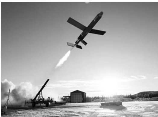
Рис. 2. Пуск БПБ “ Фаір Шедоу ” [1]

Стартова маса БПБ “ Фаір Шедоу ” – близько 200 кг, дальність дії – до 100 км. Боєприпас може баражувати на висоті близько 4600 м протягом 6 годин. БПБ стартує з наземної пускової установки рейкового типу (рис. 2),