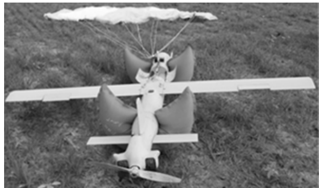
Рис. 6. БПБ “Спарроу” після приземлення [10]

На рис. 6 показано, якими засобами забезпечення посадки повинен забезпечуватись БПБ – це парашут та подушки для уникнення пошкодження елементів БПБ.