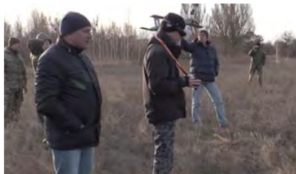
Рис. 9. Дослідницькі випробування БПБ вітчизняного виробництва

Розробка БПБ в Україні. Першими кроками на шляху створення БПБ вітчизняного виробництва є розробки ТОВ “Перший контакт” (рис. 9). Поштовхом до проведення таких розробок, безумовно, стало проведення антитерористичної операції на сході України, коли гостро виникла проблема виявлення та ураження вогневих точок мінометних розрахунків, снайперів, артилерії та систем залпового вогню.