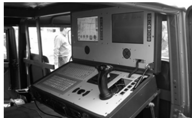
Рис. 7. Пункт управління БПБ “Спарроу” [10]

На рис. 7 показано пункт управління, де знаходиться екіпаж. Можна побачити джойстик управління БПБ, монітор обробки відео інформації, пілотажно-плановий монітор.