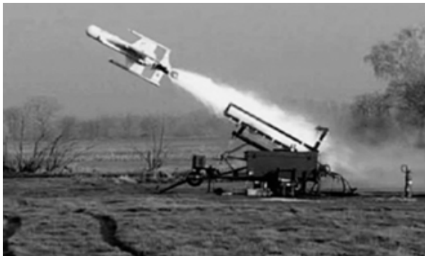
Рис. 4. Пуск БПБ “Тайфун” [9]

Конструктивно БПБ “Тайфун” має верхній і нижній кілі великої площі, широко застосовує радіопоглинаючі матеріали та покриття (рис. 4). В конструкції БПБ застосовуються заходи по зниженню рівня шуму та інфра-червоного поля силової установки. Система наведення БПБ “Тайфун” – комбінована, що складається з елементів пасивної радіолокації, а також оптико-електронної та інфрачервоної апаратури. Заявлена дальність дії захищеної лінії зв’язку та обміну даними – не менше 200 км.