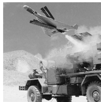
Рис. 1. Пуск БПБ “Харпі” [5]

БПБ “Харпі” (“Harpy”). Піонером в своєму виді є БПБ “Харпі”, який створено фірмою Israel Aircraft Industries (IAI) [4] (рис. 1).