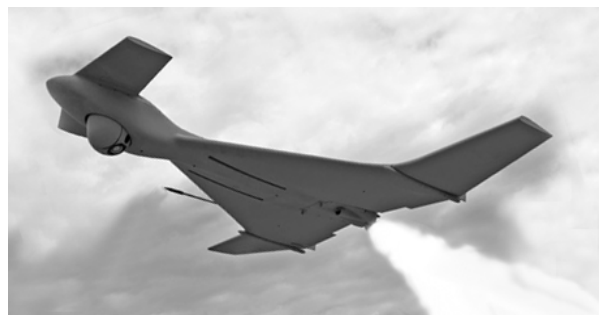
Рис. 3. БПБ “ Хароп ” [7]

В склад комплексу входять БПБ, виконаний за інтегральною аеродинамічною схемою типу “літаюче крило” з переднім горизонтальним оперенням, а також мобільний командний пункт і транспортно-пускові контейнери. БПБ “ Хароп ” має максимальну довжину 2,5 м, розмах крила 3,0 м, максимальну злітну масу 135 кг і максимальну дальність польоту до 1000 км. БПБ має можливість баражувати в районі цілі до 6 годин. Маса осколково-фугасної БЧ – 23 кг.