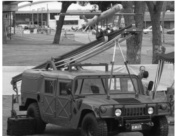
Рис. 5. БПБ “Спарроу”, встановлений на пристрій для запуску пересувного командного пункту [10]

БПБ “Спарроу” (“Sparrow”). Прикладом для складових БпАК типу БПБ може послужити БПБ “Спарроу”, який розроблено фірмою E.M.I.T UAV Company (рис. 5). БПБ має максимальну довжину 2,14 м, розмах крила 2,44 м, злітну масу 45 кг, може брати корисне навантаження масою до 12 кг і оснащується двоциліндровим двотактним поршневым двигуном, який приводить в дію повітряний гвинт, що штовхає.