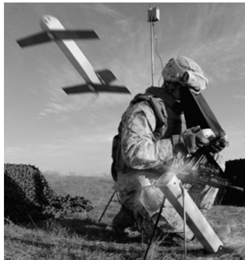
Рис. 8. Пуск БПБ “Світчблейд” [13]

Конструктивно апарат буде уявляти собою малогабаритний переносний комплекс з БПБ, який зможе вражати стаціонарні та рухомі цілі. Одними з основних вимог ВПС під час створення БПБ були: маса боеприпасу – близько 1,36 кг, можливість приведення системи в боеготове положення – не більше ніж за 30 секунд. Система наведення апарату повинна бути здатною протягом 20 секунд після запуску виявити ціль типу “людина” на максимальній дальності польоту апарату. Ураження цілі допускається з точністю не більше 1 м, радіус гарантованого ураження особового складу в засобах індивідуального бронезахисту й усередині легкої бронетехніки – не менше 2 м. Швидкість пікірування повинна досягати 35...44 м/с, при цьому висота польоту апарату повинна складати близько 100 м. У випадку, якщо ціль не виявлялася, апарат повинен був баражувати в районі в режимі очікування протягом не менше ніж 30 хв.