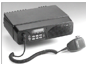
Рис. 2. Зовнішній вигляд багатоцільової радіостанції HF-SSB

моподібного сигналу з використанням восьми частот у межах смути частот 420-450 МГц із регульованою потужністю вихідного сигналу. Радіотерминали мають убудовану систему контролю працездатності й пошуку несправностей. Особливої уваги заслуговує технологія програмованих радіостанцій SDR (Software Defined Radio), яка дозволяє змінювати режими роботи програмними, а не апаратними методами, що можливо виконувати навіть в польових умовах. В США основна програма, що використовує технологію SDR – об'єднана тактична система радіозв'язку JTRS (Joint Tactical Radio System). Мета цієї програми – випуск сімейства тактичних радіостанцій для передавання мовних та відеоданих в діапазоні від 2МГц до 2ГГц. В Європі компанії Thales (раніш – Thomson-CSF Comsys, Франція) і фірма EADS (раніш – Daimler Chrysler Aerospace, Німеччина) працюють по проекту, що передбачає створення мережі радіостанцій, вузлами яких стануть мультидіапазонні багаторежимні станції MMR-ADM (Multimode Multiband Radio Advanced). На озброєння армії НАТО прийнята багатоцільова короткохвильова радіостанція MOTOROLA MICOM – 2 в стаціонарних та мобільних варіантах (рис. 2).