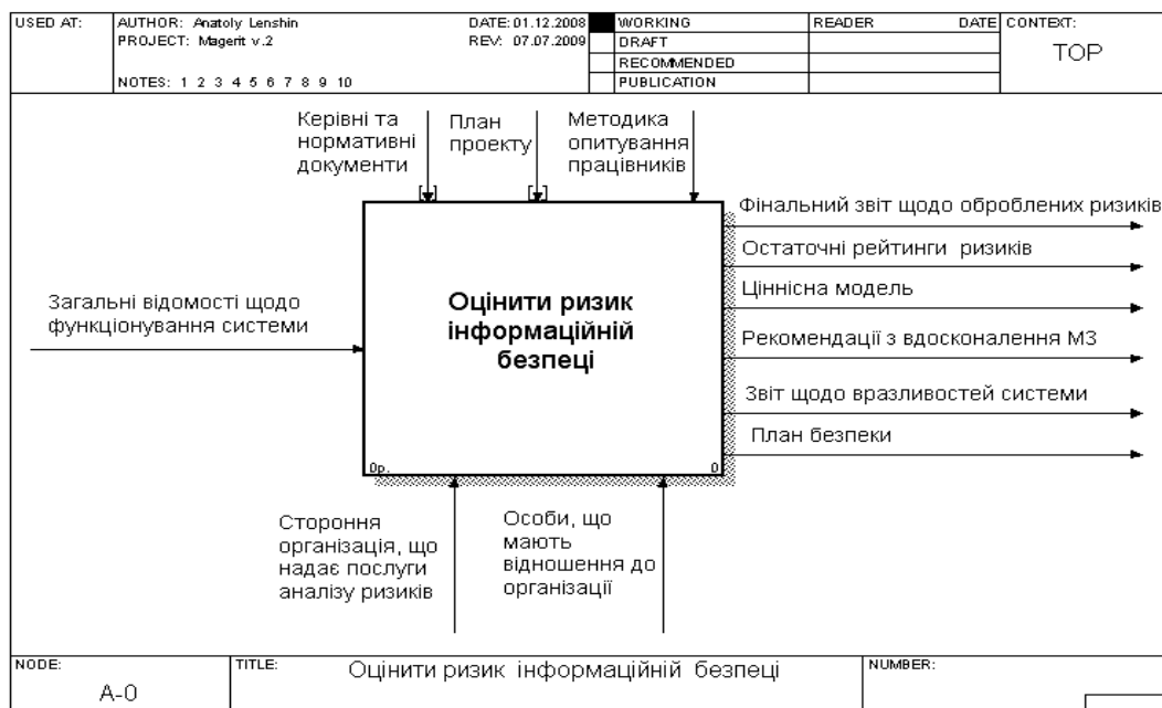
Рис. 2. Контекстна діаграма процесу ОР у нотації IDEF-0

DFD – стандарт для створення моделі потоків інформації, що циркулює в ІТС. Модель системи визначається як ієрархія діаграм потоків даних, що описують асинхронний процес перетворення інформації від введення у систему до отримання користувачем. DFD визначає, яким чином кожний процес перетворює вхідні дані у вихідні та дозволяє виявити співвідношення між процесами.