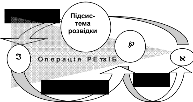
Рис. 3. Проективно-дескриптивна модель «інформаційного протиборства» в операції

Визначення складових критерію (9) є окремою науковою задачею, яку доцільно вирішувати на основі комплексування та розвитку у галузь радіоелектронної та інформаційної боротьби математичного апарату теорії інформації та масового обслуговування при формалізації дескриптивної моделі, рис.3.