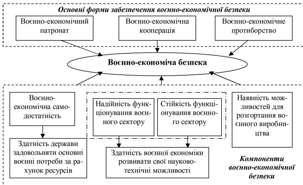
Рис. 2. Забезпечення воєнно-економічної безпеки держави

Мобілізаційне розгортання економіки (економічна мобілізація) є з одного боку крайньою мірою підготування держави до масштабної (регіональної) війни, а з іншого боку – достатньо інертним (безповоротним) процесом нарощування воєнного виробництва, який в умовах підготовки до війни неможливо зупинити. Тому структурно-логічна схема визначення цільових напрямків (шляхів, програм) забезпечення ВЕБ держави повинна передбачати обґрунтування стратегії ВЕБ з врахуванням як програм