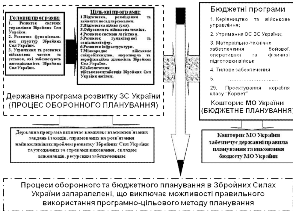
Рис. 2. Щодо впровадження оборонного та бюджетного планування в ЗС України