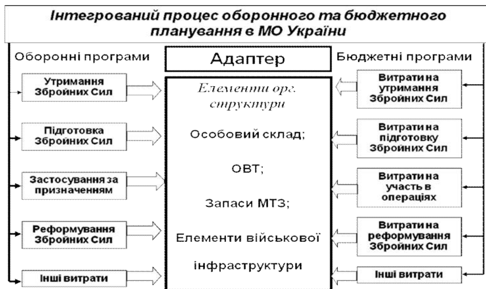
Рис. 3. Ідеальний варіант інтеграції процесів оборонного та бюджетного планування за напрямками

Ідеальним варіантом інтеграції процесів оборонного та бюджетного планування в МО України було б мати повну відповідність оборонних та бюджетних програм (рис. 3).