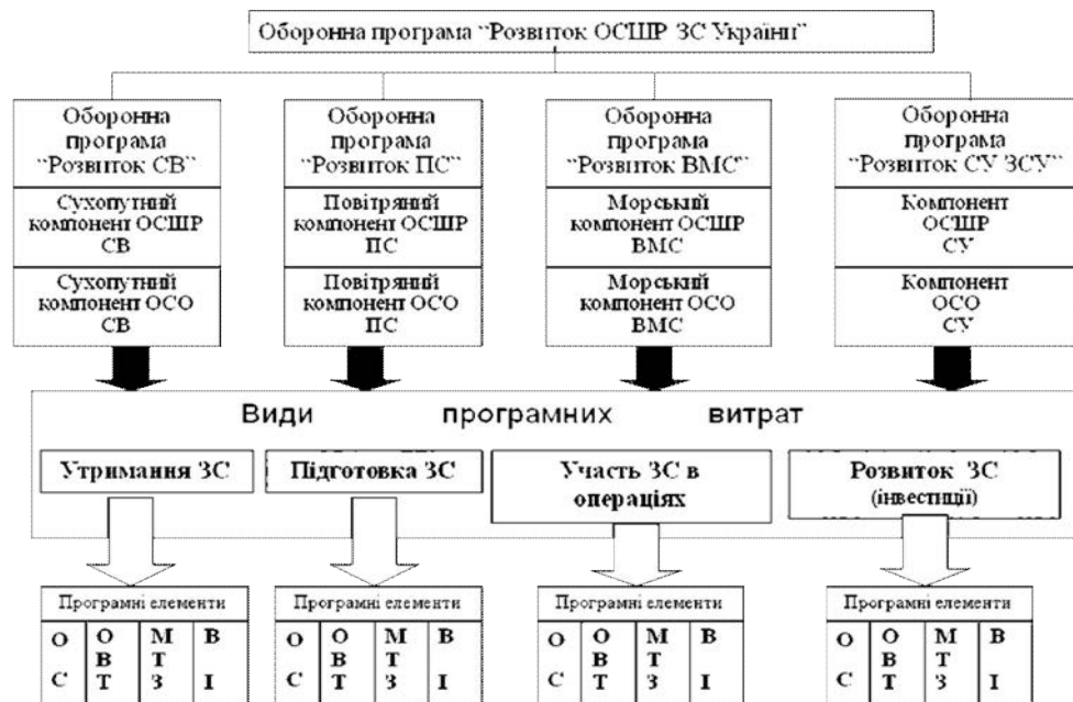
Рис. 4. Сполучення КПКВ, КЕКВ, статей витрат бюджетних коштів

Результати досягнення цілі за кожною з оборонних програм та рівень їх досягнення (тобто показники ефективності) повинні чітко визначатися з вартісних показників бюджетних програм, які класифіковані за видами програмних витрат та програмними елементами.