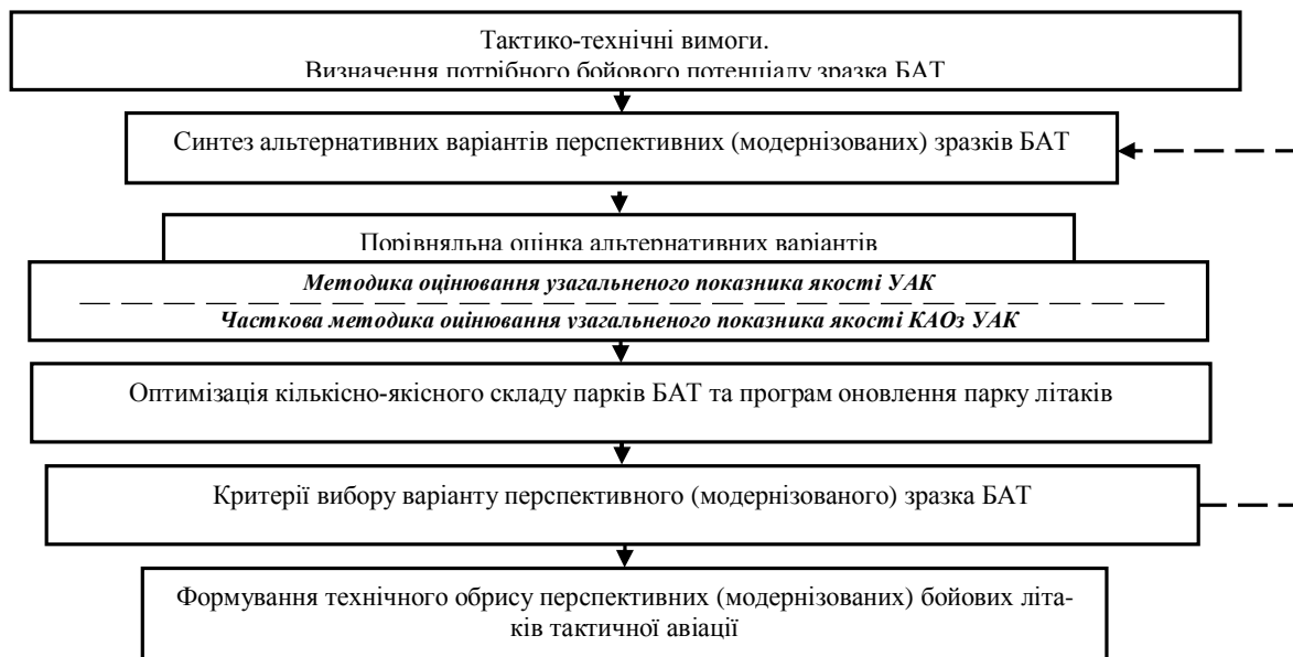
Рис. 1. Формування технічного обриса перспективних (модернізованих) УАК

гальнених показників якості КАОз на прикладі УАК [5] дозволяють сформулювати удосконалену часткову методику оцінки узагальненого показника якості (УПЯ) КАОз літаків тактичної авіації, зміст якої схематично наведено на рис. 2.