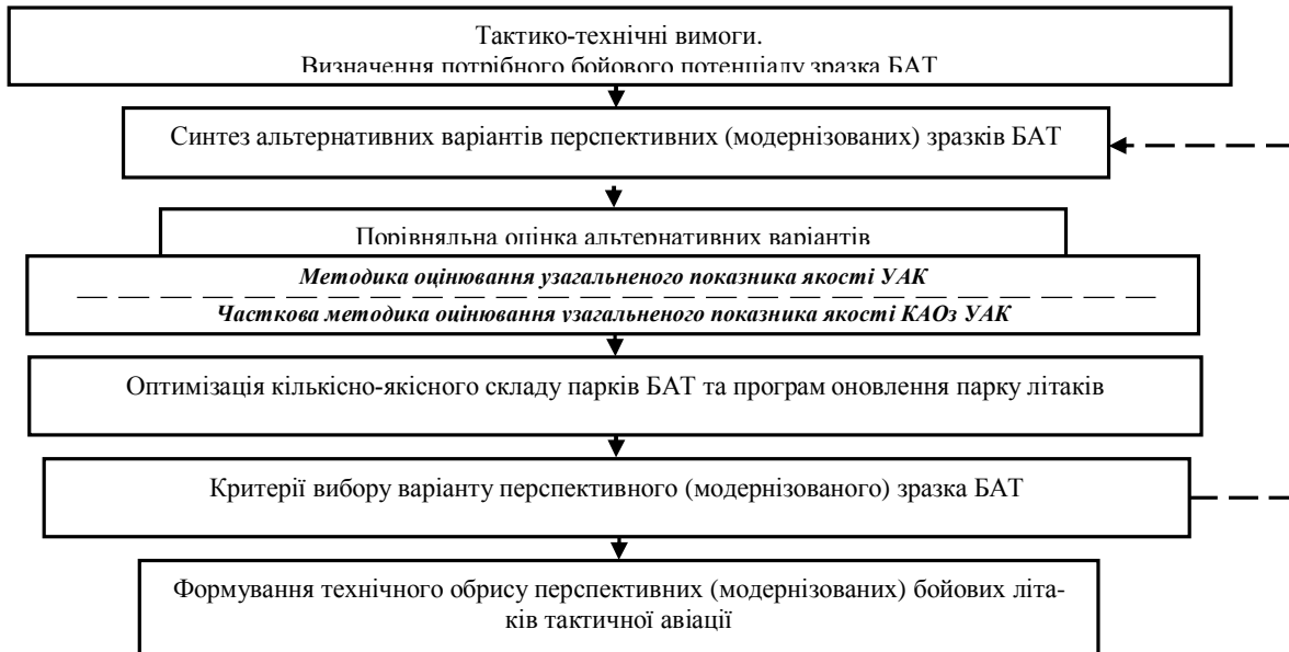
Рис. 1. Формування технічного обриса перспективних (модернізованих) УАК

гальнених показників якості КАОз на прикладі УАК [5] дозволяють сформулювати удосконалену часткову методику оцінки узагальненого показника якості (УПЯ) КАОз літаків тактичної авіації, зміст якої схематично наведено на рис. 2.