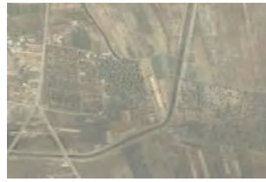
Рис. 2. Неискаженная область изображения

Рассмотрим две характерные области на исходном изображении g : указанные области отмечены на исходном изображении (рис. 1) цифрой 1 – неискаженная и цифрой 2 – искаженная и в увеличенном виде представлены на рис. 2 и рис. 3.