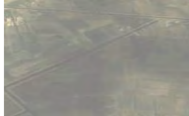
Рис. 3. Искаженная область изображения

В процессе восстановления по методике обработки изображений при воздействии протяженных маскирующих помех, рассмотренной в [23], получено восстановленное изображение (рис. 4).