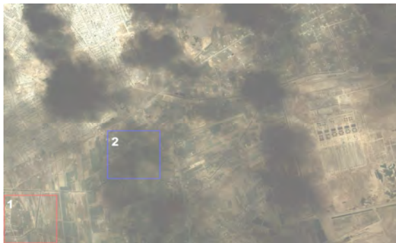
Рис. 1. Исходное изображение

Исходное изображение представлено на рис. 1. Это – изображение территории Ирака во время боевых действий 2003 года «Свобода Ираку», взятое с сайта компании Space Imaging [26]. Данное изображение получено с помощью космической системы оптико-электронного наблюдения «Ikonos».