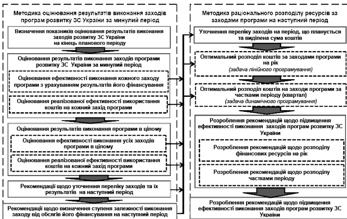
Рис. 1. Загальний зміст методичного підходу щодо підвищення ефективності виконання заходів програм розвитку ЗС України

ний період із врахуванням воєнно-економічного результатів їх виконання протягом минулого періоду наведений на рис. 1. Він базується на використанні результатів методики воєнно-економічного оцінювання виконання заходів програм розвитку ЗС за минулий період [4].