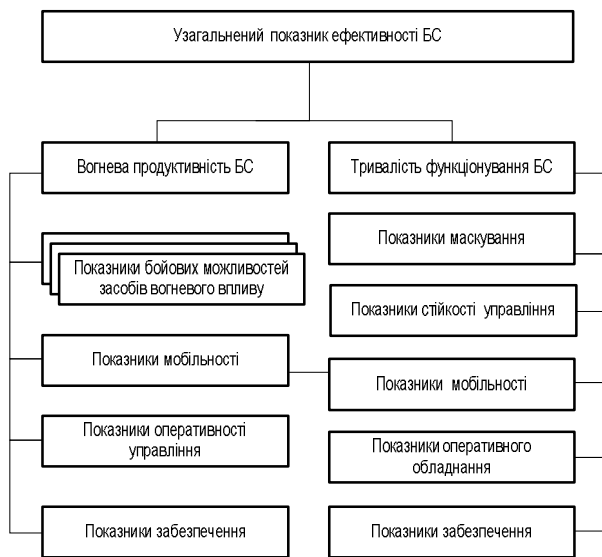
Рис. 2. Дерево показників ефективності бойової системи

Враховуючи те, що перемінні, які входять у (6), є показниками складних властивостей БС, вони можуть бути з необхідним ступенем деталізації розділені на складові частини (рис. 2).