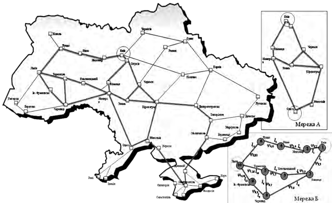
Рис. 1. Варіант загальної схеми державної цифрової мережі зв'язку України та виділені мережі між штабами (варіант мереж: А – зв'язок Київ-Одеса; Б – зв'язок Київ-Львів)

Якщо після вибору нової структури ON і рішення комплексної задачі вимоги не виконуються, необхідно переглянути початкові дані (етап 1) у бік послаблення QoS – вимог, якщо це можливо. Інакше деякі трафіки, як правило менш пріоритетні, дістають відмову в обслуговуванні. Для дослідження ефективності запропонованого методу в умовах розподіленого управління мережевими ресурсами розглядалися можливі варіанти підструктури магістральної мережі між підрозділами штабів оперативно-тактичного рівню (підмережі А, Б) (рис. 1) мережі Укртелеком.