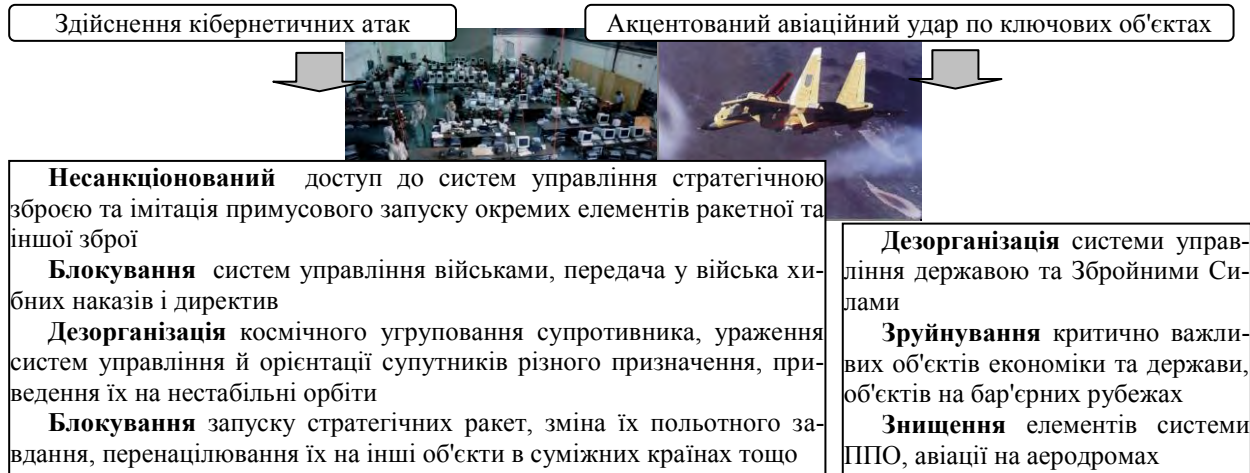
Рис. 2. Кібернетично-вогневий удар

електронно-вогневий заслон – одночасне застосування на найбільш ймовірних напрямках дій засобів повітряного нападу противника різномірних засобів авіації, протиповітряної оборони та радіоелектронної боротьби з метою його знищення або припинення протиправних дій;