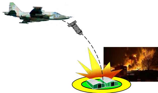
Рис. 1. Акцентований авіаційний удар

акцентований авіаційний удар (рис. 1) – нанесення випереджувального удару по найбільш важливих (ключових) та найуразливіших об'єктах противника з нанесенням йому найбільшого збитку (шкоди). Для визначення таких об'єктів потрібно враховувати значну кількість характеристик, що обумовлює доцільність застосування для вирішення цієї задачі крім формальних методів також методів безпосереднього експертного оцінювання або методу аналіз ієрархій [6];