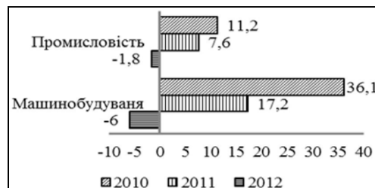
Рис. 1. Динаміка промислового виробництва у 2010 – 2012 рр., %

Більш того, незважаючи на те, що в 2010-2011 рр. темпи росту виробництва промислової продукції в цілому, і машинобудівної продукції зокрема, підвищувались, це майже не вплинуло на фінансові результати галузі. Так, на рис. 2 представлено дані щодо частки промислових підприємств, що одержали збиток до оподаткування у період 2005-2012 років [1, 2]. Як бачимо, починаючи з 2008 року спостерігається стагнація збитків, при чому стагнація на відносно високому рівні – близько 40% промислових підприємств отримують негативний фінансовий результат.