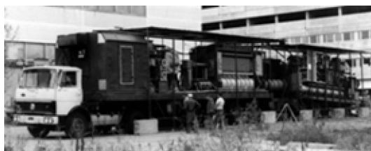
Рис. 2. Мобільний лазерний технологічний комплекс МЛТК-50

Комплекс МЛТК-50 був створений на основі імпульсно-періодичного електроіонізаційного CO 2 -лазера відкритого контуру з потужністю 50 кВт. Обладнання розміщувалося на двох автомобільних напівпричепках, вага дорівнювала 48 тонн (рис. 2).