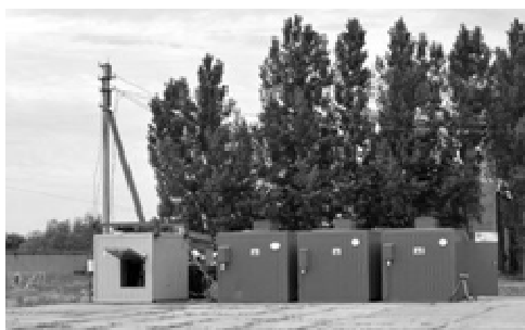
Рис. 5. Мобільний лазерний технологічний комплекс МЛТК-20

За рахунок застосування плівок надається можливість розподілити під час оброблення виробів на "брудну" та "чисту" зони.