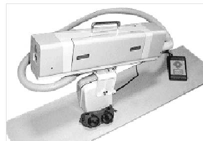
Рис. 4. Мобільний лазерний комплекс для дезактивації

У 2003 році НПП "Лазерні технології" (Росія) був розроблений мобільний лазерний комплекс для дезактивації. Обробка в даному випадку відбувається крізь плівку лазерним променем, а окисли які відлітають з поверхні деталі, сорбуються на клеєвій речовині нанесеній на одну з боків плівки (рис. 4).