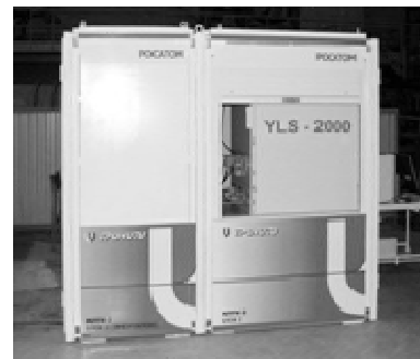
Рис. 3. Мобільний лазерний технологічний комплекс МЛТК-2

Лазерний комплекс МЛТК-3 практично ідентичний комплексу МЛТК-2, що містить у собі три 1 кВт – лазерні джерела та системи охолодження. Вага кожного із 7 блоків не перевищує 100 кг.