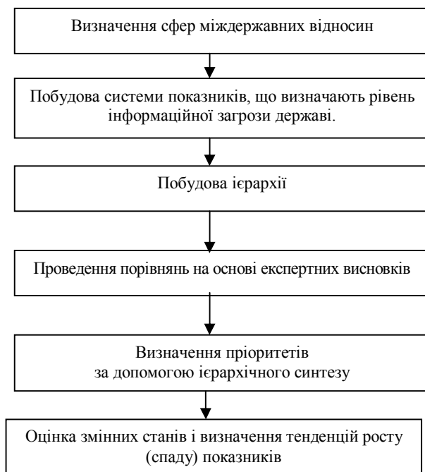
Рис. 1. Послідовність визначення пріоритетів окремих показників, що характеризують рівень інформаційної загрози

Матриця парних порівнянь для визначення пріоритетів сфер міждержавних відносин має вигляд: