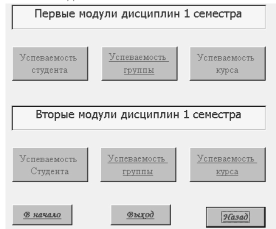
Рис. 2. Пример оформления формы навигации

Подсистема учета успеваемости студентов состоит из форм навигации (рис. 2) и блоков баз данных по отдельным годам набора студентов, число которых соответствует числу лет обучения в данном учебном заведении.