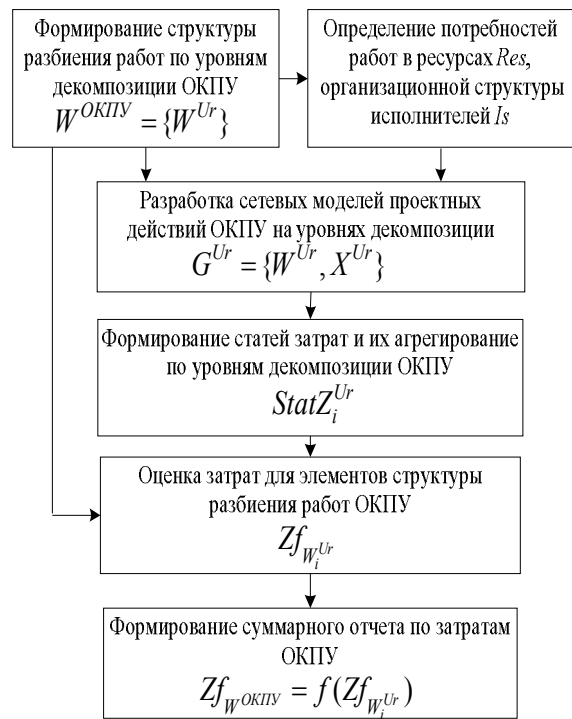
Рис. 2. Алгоритм формирования предварительной сметы затрат ОКПУ

– стоимость исследований и разработок : проведение прединвестиционных исследований, маркетинговые исследования, анализ затрат и выгод, НИР, ОКР, разработка технической, конструкторской и проектной документации на изделие РКТ;