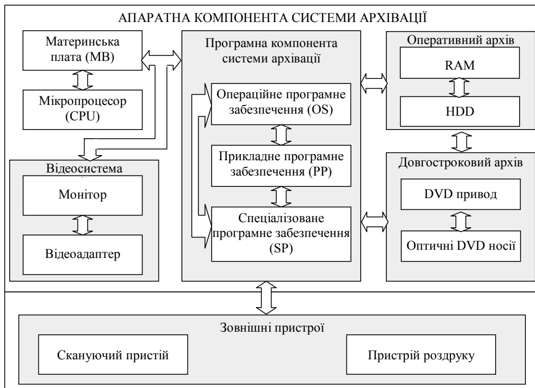
Рис. 2. Структурна схема системи архівації даних авіаційно-космічного спостереження

За нормованими значеннями, що описують зміну інтегрованого показника приймається рішення про оптимальний варіант побудови структури апаратної компоненти системи архівації даних авіаційно-космічного спостереження за системою критеріїв (1) згідно правила (13).