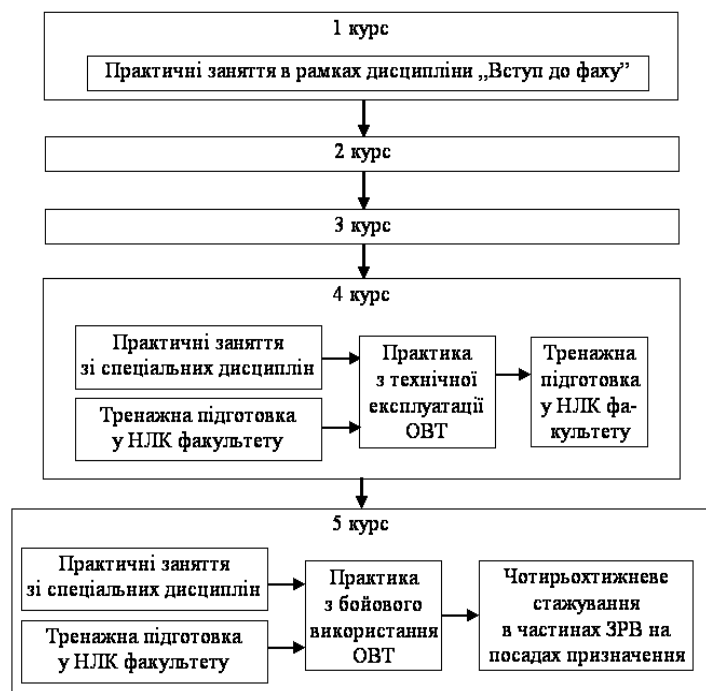
Рис. 1. Існуюча система практичної підготовки випускників факультету ЗРВ

Система практичної підготовки фахівців ЗРВ, що існує на факультеті, наведена на рис. 1, визначається вимогами освітньо-кваліфікаційних характеристик, розроблених у 1998 році. Враховуючи вимоги наказу Міністра оборони України від 13.08.07 р. № 463 „Про вдосконалення змісту підготовки військових фахівців для Збройних Сил України за освітньо-кваліфікаційним рівнем бакалавра” [1] вони потребують переробки. До недоліків існуючої системи підготовки слід віднести: