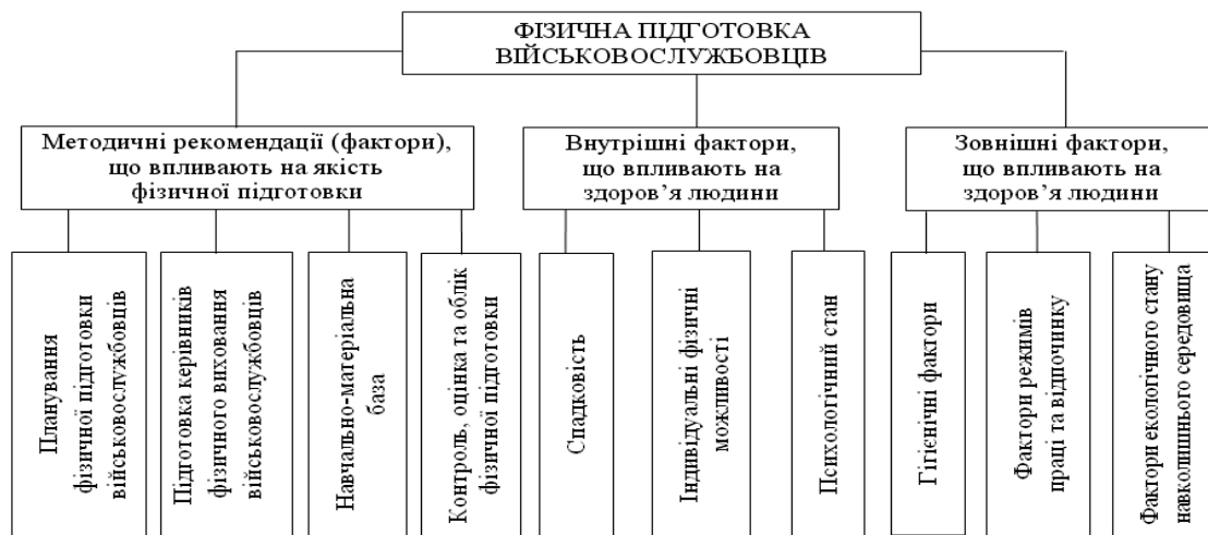
Рис. 1. Фактори, що впливають на якість фізичної підготовки військовослужбовців

Без забезпечення належного рівня здоров'я майбутніх військовослужбовців не можна вести мову про їх ефективну фізичну підготовку. Здоров'я – це правильна, нормальна діяльність організму, його повне фізичне та психічне благополуччя [2]. Здоров'я залежить від наступних показників: спадковості, психологічного стану, факторів екологічного стану навколишнього середовища, режиму та праці та ін.