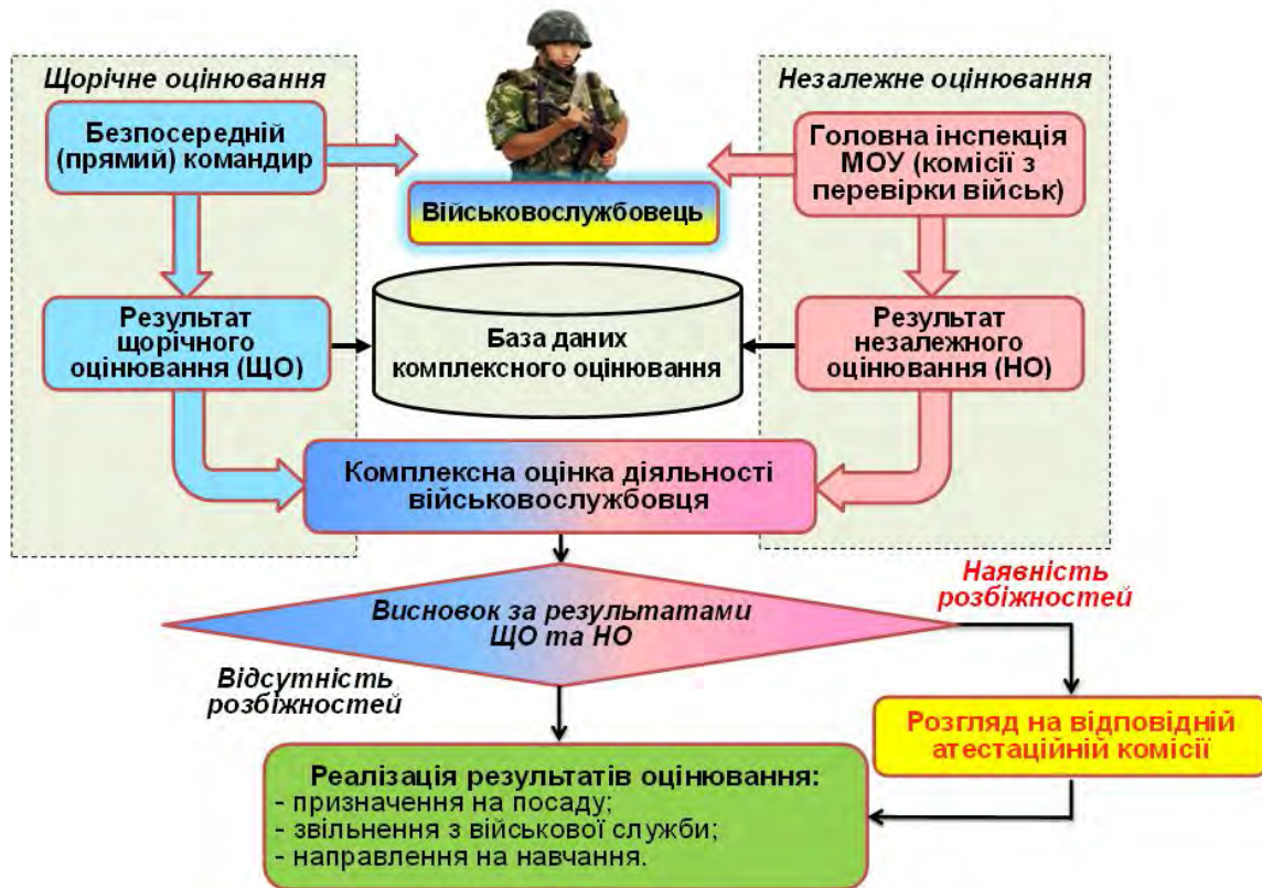
Рис. 1. Схема формування та реалізації результатів оцінювання військовослужбовця

(комісіями, призначеними відповідними посадовими особами) із залученням необхідних спеціалістів (експертів), які здійснюють незалежну оцінку діяльності органів військового управління, військових частин (підрозділів) за призначенням та окремих військовослужбовців. Воно організовується у порядку і за методикою, визначеною Головною інспекцією Міністерства оборони України.