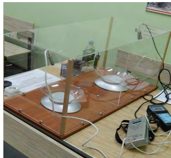
Рис. 1. Установка для дослідження залежності інтенсивності випаровування ЛЗР та ГР з відкритої поверхні від швидкості руху повітряних мас та температури навколишнього середовища

З метою вирішення поставлених завдань було розроблено експериментальну установку для дослідження залежності інтенсивності випаровування ЛЗР та ГР з відкритої поверхні від швидкості руху повітряних мас та температури навколишнього середовища (рис. 1).