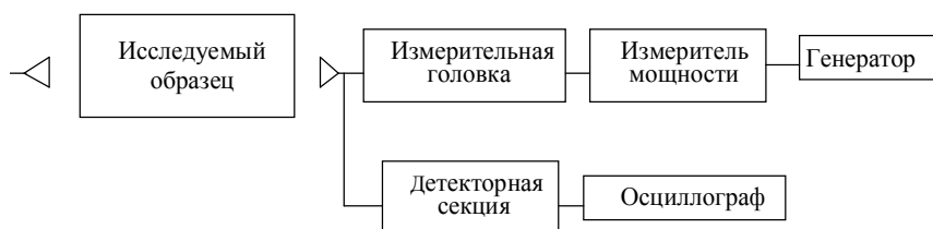
Рис. 3. Функциональная схема экспериментальной установки

Полученные композиционные материалы являются быстротвердеющими (прочность при сжатии на 1 сутки до 45 МПа), высокопрочными (прочность при сжатии на 7 сутки до 75 – 85 МПа) воздушными вязущими.