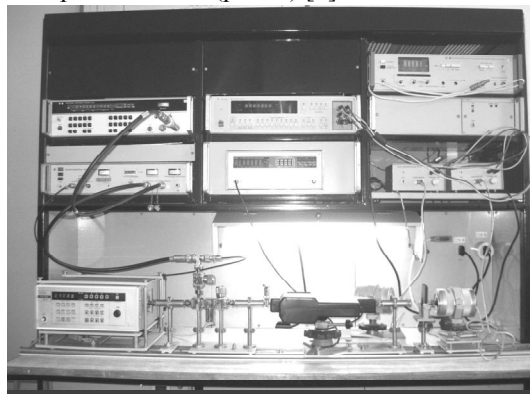
Рис. 2. Внешний вид лабораторной установки для измерения мощности отраженного и прошедшего сигнала на частоте 70-78 ГГц

Оценка экранирующей способности вязущего композиционного материала проведена теоретически и экспериментально (рис. 2) [8].