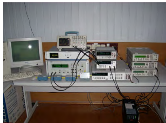
Рис. 1. Державний первинний еталон одиниці кута зсуву фаз між двома напругами

Державний первинний еталон одиниці кута зсуву фаз між двома напругами складається з комплексу засобів вимірювальної техніки (рис. 1):