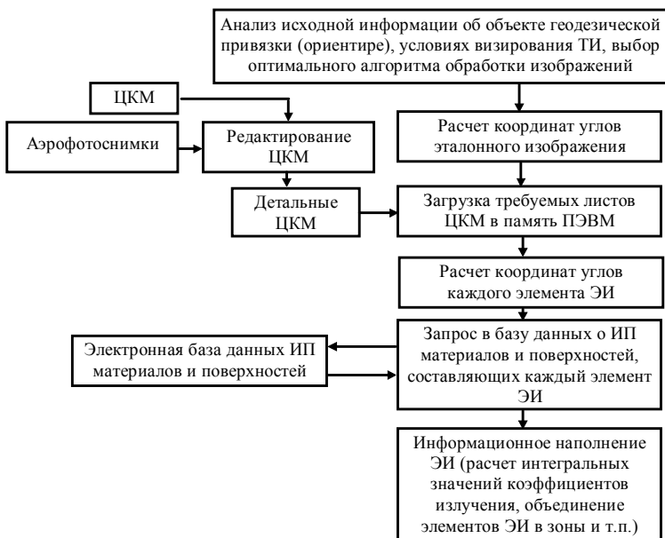
Рис. 2. Функциональная схема процесса синтеза эталонных изображений достижений геоинформационной технологии методика синтеза эталонных изображений.

На рис. 2 в виде функциональной схемы представлена разработанная с учетом современных