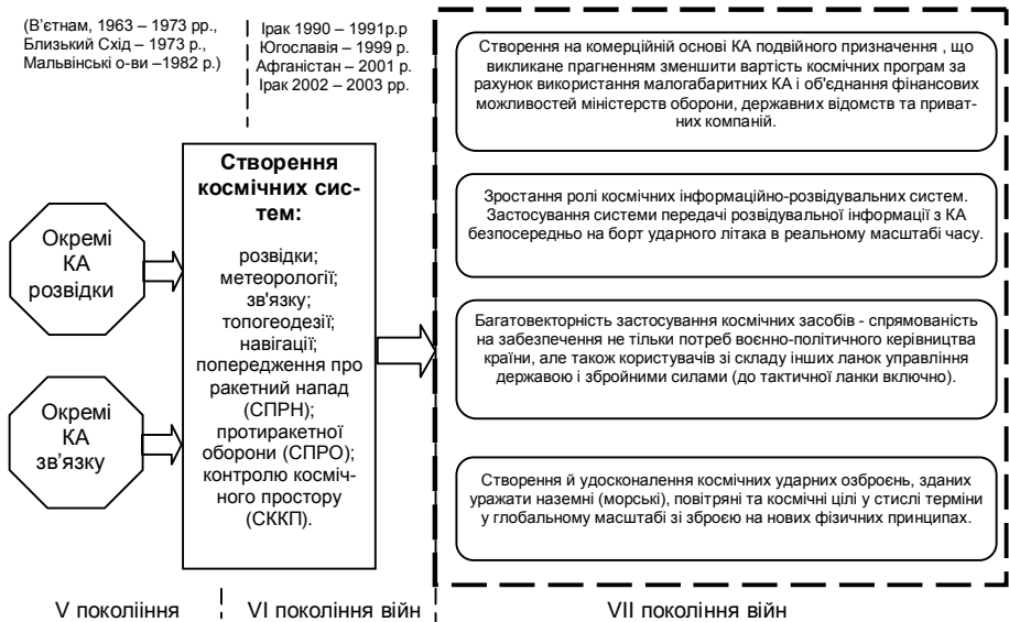
Рис. 2. Напрямки розвитку космічних систем у війнах майбутнього у порівнянні із сучасними війнами

Висновки. Таким чином держава, яка здатна вести війни майбутнього, буде вирішувати усі свої проблеми не за допомогою угруповань військ на базі живої сили, а із застосуванням великої кількості, головним чином, високоточної зброї і зброї на нових фізичних принципах та інформаційному протиборстві.