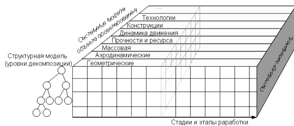
Рис. 1. Системный куб

Этап проектирования ЛА можно представить в виде системного куба (рис. 1). В котором первая грань – стадии и этапы проектирования, вторая - системные модели ЛА, третья - уровни декомпозиции.