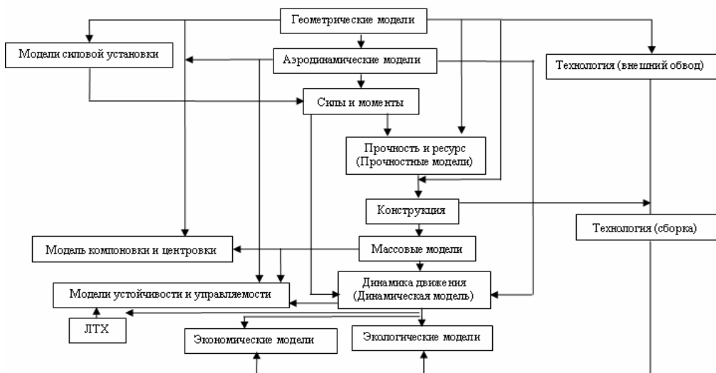
Рис. 2. Взаимосвязь между проектными моделями

Взаимосвязь моделей во время процесса проектирования отображена на рис. 2, где линиями показаны потоки данных из одной модели в другую. Как видно из рисунка все решаемые модели взаимосвязаны и при проектировании решаются одновременно, поэтому проектные модели тесно связаны друг с другом и при их решении отделы, занимающиеся данными вопросами, тесно сотрудничают.