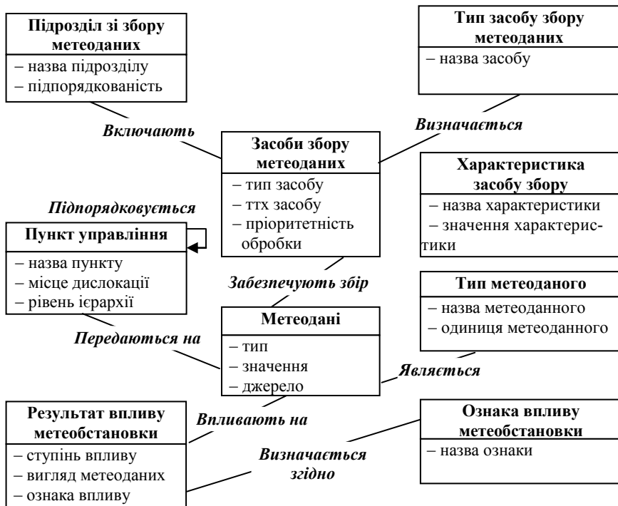
Рис. 3. Модель класів програмних об'єктів ПЗ АРМ НС РХБз

Перелік прецедентів, що реалізуються ПЗ АРМ НС РХБз: