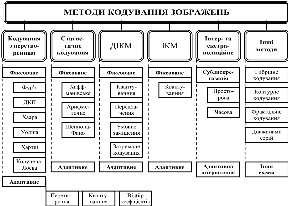
Рис. 1. Класифікація методів кодування зображень

Вони також забезпечують значно ефективніше стиснення, ніж безвтратні методи, оскільки високий ступінь стиснення досягається за рахунок зниження якості зображення під час його відновлення в порівнянні з якістю оригіналу. Кінцева мета методів стиснення з втратами – оптимізація якості зображення під вимоги системи обробки й передачі зображень при задоволенні як “об’єктивних”, так і “суб’єктивних” критеріїв якості відновлюваних зображень [16].