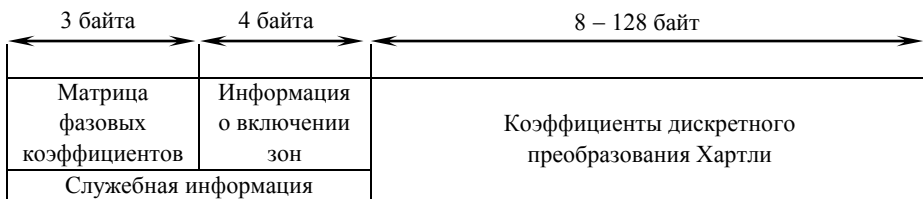
Рис. 2. Формат трансформанты ДПХ в компактном представлении

Формат трансформанты при компактном представлении в области сохраняемых данных представлен на рис. 2.