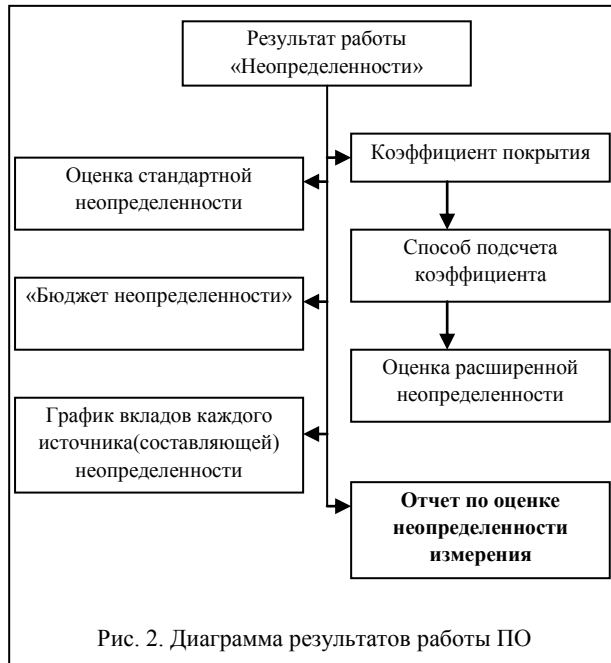
Рис. 2. Диаграмма результатов работы ПО

8) возможность использовать результаты данного оценивания для оценки неопределенности других измерений.