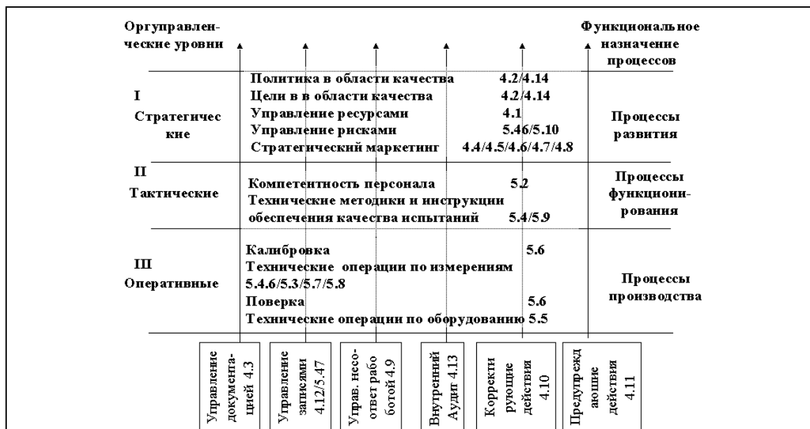
Рис. 1. Структурная схема распределения процессов системы менеджмента качества

рии в рамках СМК, можно переходить к ждения технической компетентности испытатель- рассмотрению функциональной схемы подтвер- ной лаборатории (рис. 2).