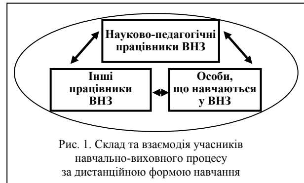
Рис. 1. Склад та взаємодія учасників навчально-виховного процесу за дистанційною формою навчання

Учасниками навчально-виховного процесу, що відбувається за дистанційною формою навчання у вищому навчальному закладі, мають бути педагогічні або науково-педагогічні працівники, інші працівники вищих навчальних закладів та особи, які навчаються (рис. 1) [7].