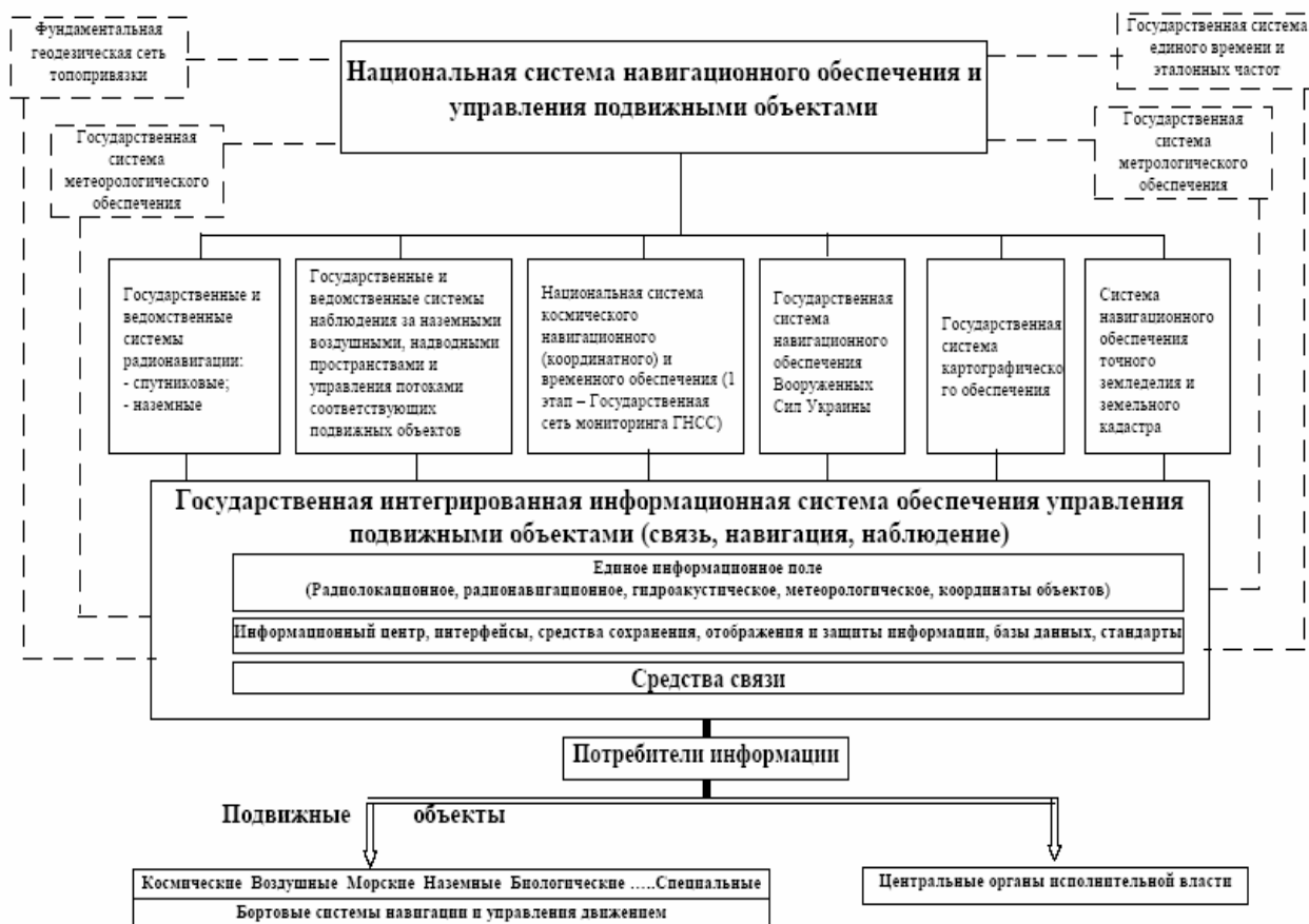
Рис. 2. Основные составляющие Национальной системы навигационного обеспечения

Общегосударственная политика в области радионавигации определяется Радионавигационным планом Украины (РНПУ), который формулирует условия обеспечения безопасности движения воздушного, морского, речного и наземного транспорта за счет предоставления надежной навигационной информации, решения задач геодезии и картографии и специальных задач, а также развития широкого международного сотрудничества в направлении совместного использования радионавигационной информации отечественными и зарубежными потребителями, в особенности при создании и использовании транспортных коридоров.