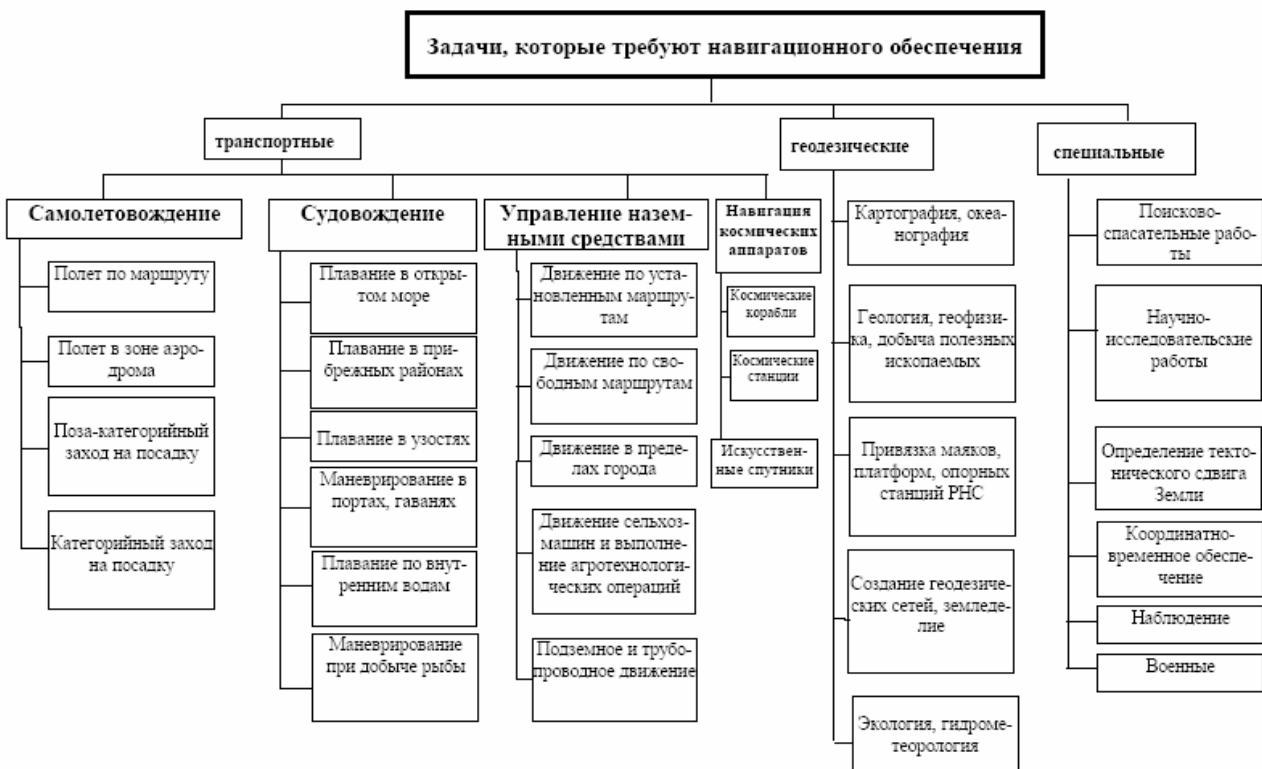
Рис. 1. Спектр задач, требующих навигационного обеспечения

Для эффективного решения вышеуказанных задач в Украине целесообразно создание Национальной системы навигационного обеспечения и управления подвижными объектами (далее Национальная система).