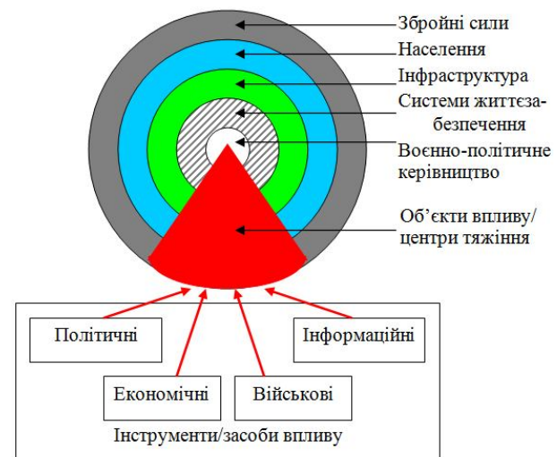
Рис. 1. Модель всебічного впливу, що була розроблена в США

ціональні лідери, що становлять критично важливу складову в системі національної безпеки. Другий шар – це система життєзабезпечення (фабрики, електростанції, нафтозаводи, банки), що під час війни є життєво важливими для забезпечення функціонування воєнно-економічного комплексу. Державна інфраструктура (автомобільні шосе, залізниці, енергетичні лінії) становить третій шар. Четвертий шар – це соціум, п'ятий шар – збройні сили.