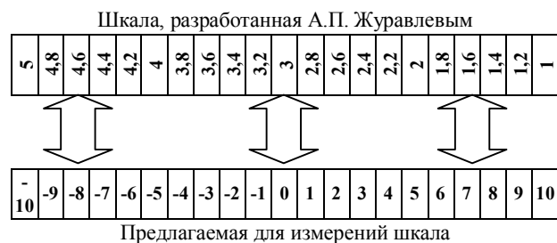
Рис. 3. Соответствие координат шкал

При таком выборе численных коэффициентов не будет наблюдаться трудностей при расчете соответствия значения между шкалой, разработанной А.П. Журавлевым (рис.1) и предлагаемой. Нет необходимости вводить различные масштабные коэффициенты на различных участках шкал. Соответствие шкалы 1 и предлагаемой приведено на рис. 3.