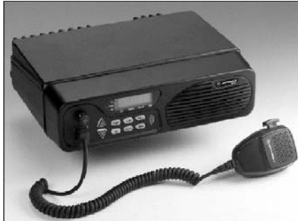
Рис. 2. Зовнішній вигляд багатоцільової радіостанції HF-SSB

На озброєння армії НАТО прийнята короткохвильова радіостанція MOTOROLA MICOM – 2 (рис. 2), яка є багатоцільовою радіостанцією, що розроблена для використання в стаціонарних та мобільних варіантах. Вона забезпечує передавання голосу, факсу та даних на великих відстанях. Особливістю цієї радіостанції є те, що вона побудована із використанням технології цифрової обробки сигналів на основі цифрових сигнальних процесорів.