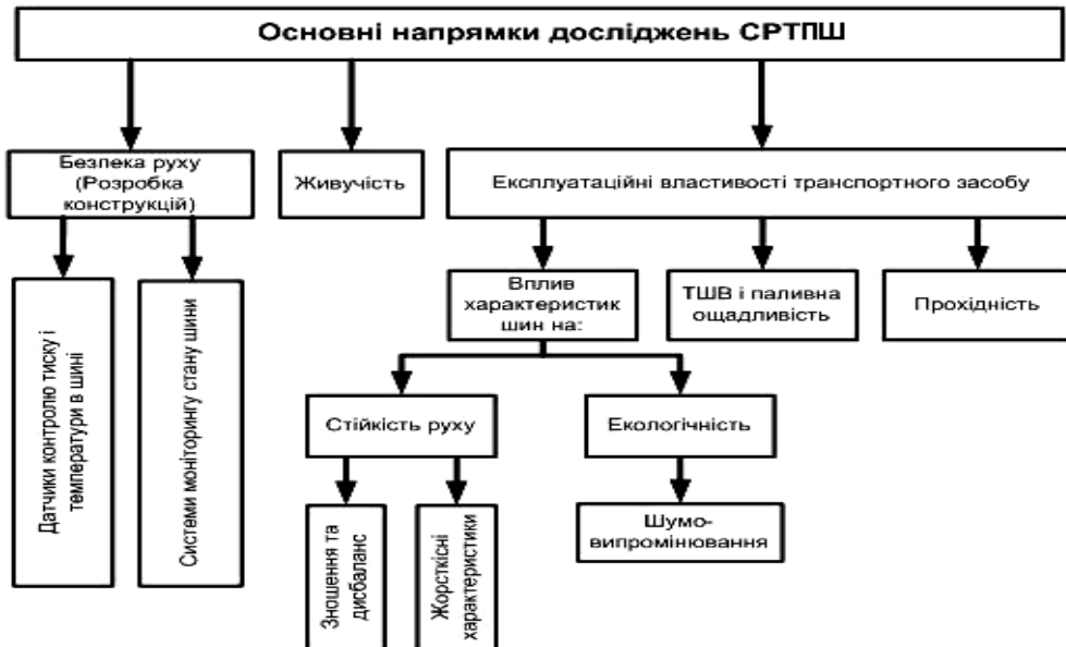
Рис. 3. Систематизація напрямків досліджень систем регулювання тиску повітря в шинах транспортних засобів

пов'язані з впливом роботи СРТПШ на експлуатаційні властивості транспортного засобу (тягошвидкісні, прохідність, керованість, стійкість руху), особливо при його використанні в екстремальних умовах військових конфліктів. Виконані роботи носять частковий характер і не охоплюють всесторонньо досліджуваної проблеми (рис. 3).