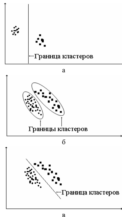
Рис. 1. Нахождение границ кластеров на основе интервального анализа (а), эллиптических функций (б) и методов вычислительной геометрии (в)

При этом наилучшим является построение разделяющих функций тривиального вида, с границами параллельными координатным осям (рис. 1, а), поскольку такая структура кластеров позволяет использовать для целей сегментации пороговые критерии. Если это не удастся, стараются найти границы кластеров в виде окружностей (эллипсов) с заданным центром и функцией рассеяния относительно центра (рис. 1, б), или в виде разделяющих функций не параллельных координатным осям, как правило, на основе использования полиномов (рис. 1, в).