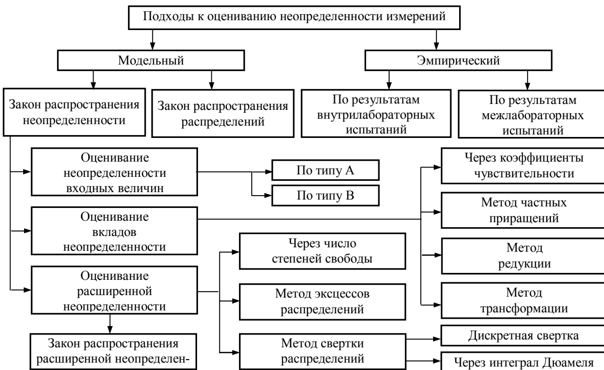
Рис. 2. Классификация подходов к оцениванию неопределенности измерений

Основные подходы оценивания неопределенности измерений можно разделить на два больших класса: модельный и эмпирический (рис. 2).