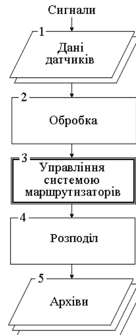
Рис. 4. Алгоритм управління розподіленою системою обробки

З датчиків по лініям зв'язку інформація поступає на обробку, де головним критерієм є час обробки: