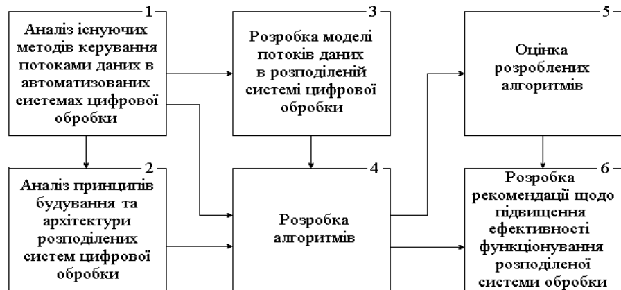
Рис. 2. Порядок проведення досліджень

зорного апарату. Тензор, як математичний засіб, дозволяє здійснити перетворення від однієї системи координат в іншу, тобто забезпечити перехід між математичними просторами. Він є зручним засобом моделювання об’єкту, який проходить через різні стадії розробки. В тензорному методі використовується загальна модель у вигляді електричної сітки, яка представляється геометричним утворенням семантичного графу з властивостями подвійності, коваріантності і контрваріантності. Такий граф дозволяє ефективно дослідити і синтезувати складні технічні і організаційні системи. Узагальнена тензорна модель служить основою для проектування багатьох систем, тобто одна і та ж модель інтерпретується в різні предметні області (рис. 3).