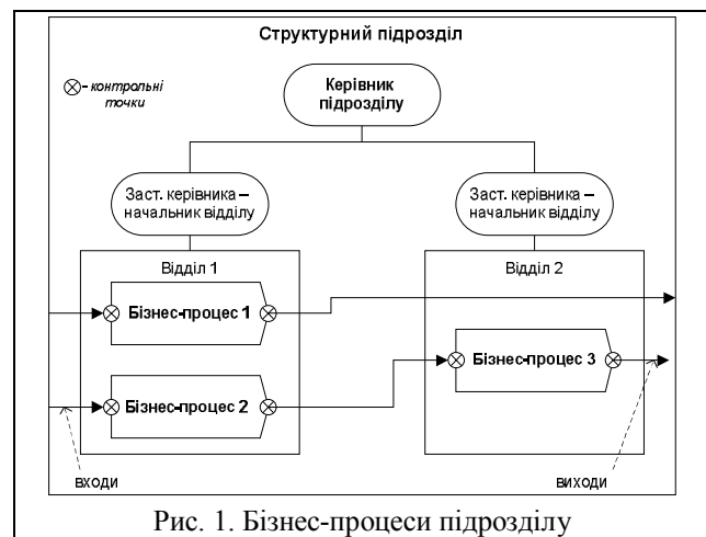
Рис. 1. Бізнес-процеси підрозділу

ням керівника структурного підрозділу. Він же є власником процесів підрозділу, як показано на рис. 1 [2].