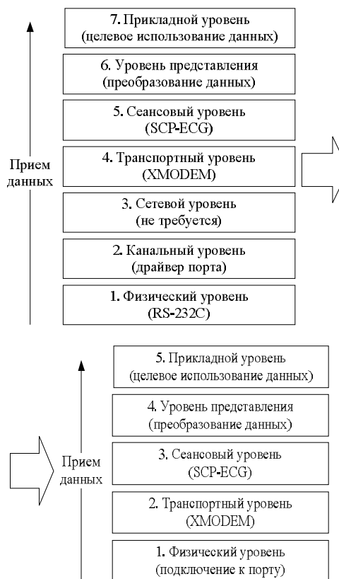
Рис. 1. Прием данных компьютерной системой с медицинского устройства

С точки зрения модели OSI прием данных компьютерной системой с медицинского устройства выглядит так, как представлено на рис. 1. Полная модель взаимодействия компьютерной системы и медицинского устройства состоит из 7 уровней (верхняя часть рис. 1).