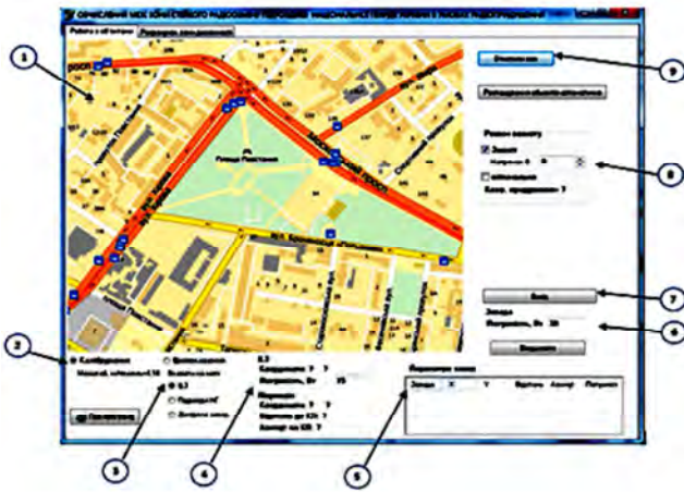
Рис. 1. Програмний інтерфейс моделювання роботи радіоканалу