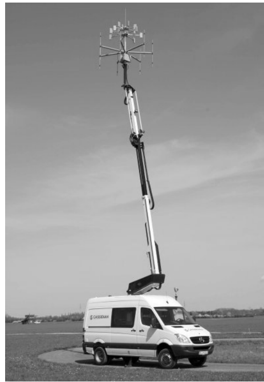
Рис. 1 Пасивна РЛС компанії Cassidian Європейського космічного концерну EADS

У 2012 році компанія Cassidian Європейського космічного концерну EADS представила новітню розробку пасивної РЛС, яка може бути встановлена на шасі та представляє двохвісний автобус, в салоні якого змонтована вся електроніка, а на даху – телескопічна штанга з блоком приймальних антен (рис. 1) [21]. Оновлення інформації на дисплеї оператора проводиться раз у пів секунди. Пасивна РЛС працює у трьох радіодіапазонах: ультракороткохвильовий, DAB (цифрове радіо), DVB-T (цифрове телебачення). Помилка при виявленні цілі не перевищує 10 м [21].