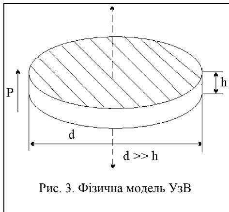
Рис. 3. Фізична модель УзВ

Рівняння руху в елементарному об'ємі для нашого випадку буде мати вигляд: