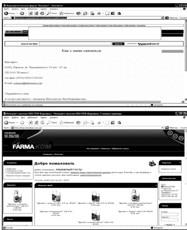
Рис. 2. Порівняння якості візуального дизайну

Спочатку представлено сайт фірми «Компас», де спостерігається примітивність оформлення, скудність візуальних елементів.