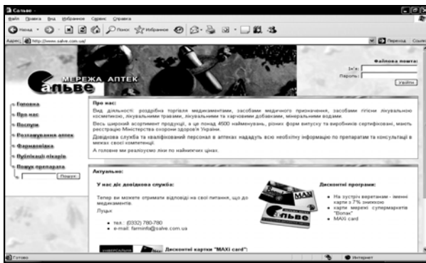
Рис. 5. Якісний сайт фармацевтичної мережі аптек «Сальве»

гації по сайту, а також не краще кольорове оформлення.