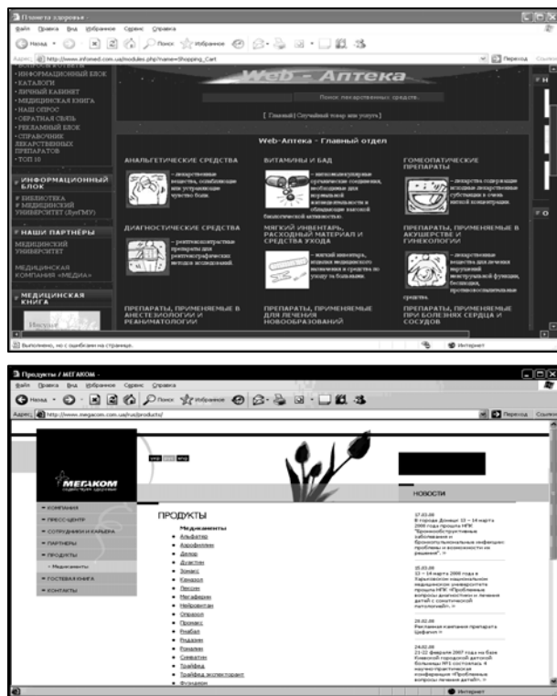
Рис. 4. Варіанти представлення рубрикатора ліків

Прикладами якісно розроблених, професійно наповнених та підтримуваних сайтів є сайт фірми «Фалбі», а також мережі аптек «Сальве» (рис. 5).