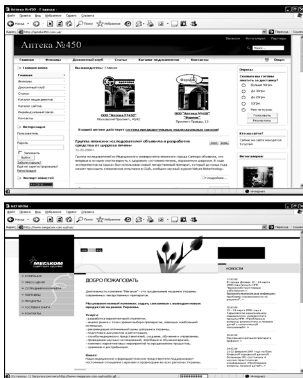
Рис. 3. Порівняння інформативності сайтів

І навпаки, рубрикатор, зображений нижче, має примітивну списочну побудову і лише текстове представлення інформації, містить неструктурований перелік продукції, чого явно недостатньо для комфортного швидкого пошуку при великій кількості пропонуваніх до продажу лікарських препаратів.