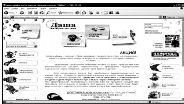
Рис. 7. Сайт з безсистемним перевантаженням графікою

Сайт інтернет-аптеки «Даша», зображений на рис. 7, при великій кількості візуальних елементів і рубрик є явно перевантаженим графікою та слабо, безсистемно структурованим, що створює труднощі й плутанину при роботі користувачів з ним.