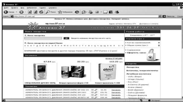
Рис. 6. Сайт з різним рівнем окремих параметрів

Сайт інтернет-аптеки «Даша», зображений на рис. 7, при великій кількості візуальних елементів і рубрик є явно перевантаженим графікою та слабо, безсистемно структурованим, що створює труднощі й плутанину при роботі користувачів з ним.