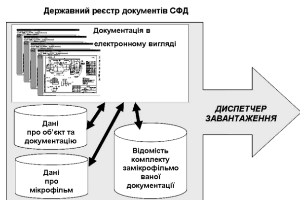
Рис. 2. Схема завантаження даних у сховище

тання інтеграції на основі єдиної понятійної моделі предметної області (concept-centric) [1].