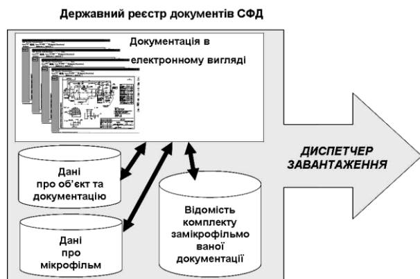
Рис. 2. Схема завантаження даних у сховище

тання інтеграції на основі єдиної понятійної моделі предметної області (concept-centric) [1].